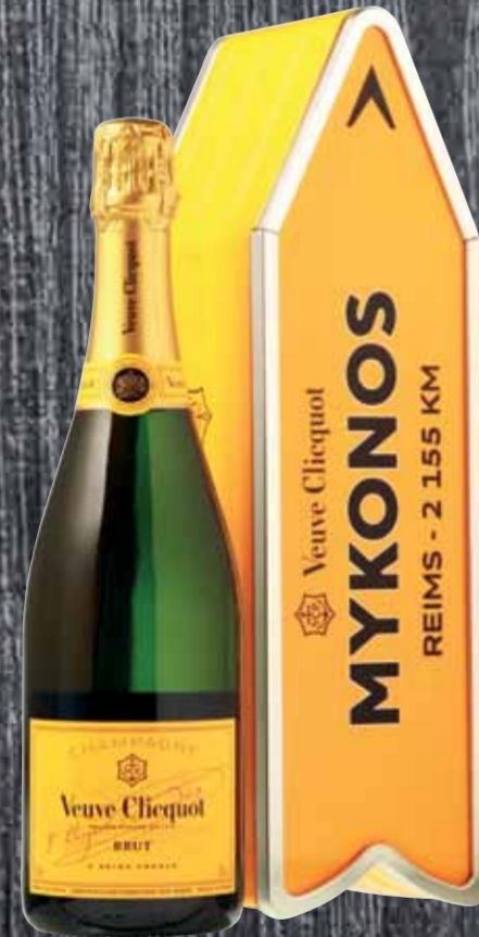
Champagne brut Wegweiser Veuve Clicquot 75cl | 49.90