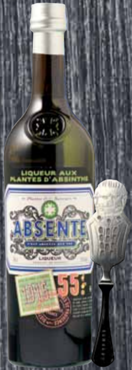
Absente mit Löffel Dist. et Dom. de Provence 70cl | 55% | 44.50