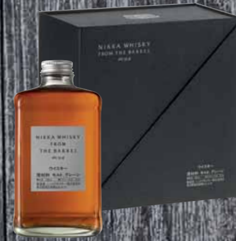
Whisky From the Barrel mit Glas & Ausgesser Nikka 50cl | 51,4% | 67.-