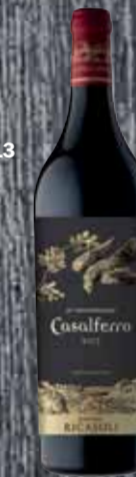
Casaferro IGT Special Anniversary Edition 2013 Barone Ricasoli 75cl | 45.-