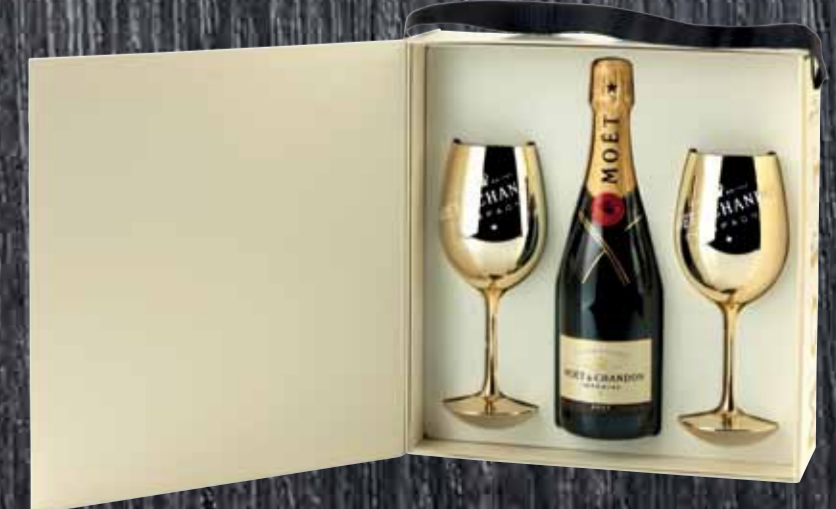
Moët & Chandon Brut mit 2 Goldgläsern Moët & Chandon 75cl | 95.-