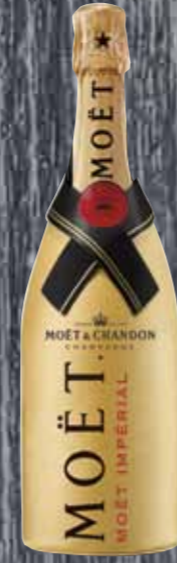
Champagne brut Diamond Suit Gold Moët & Chandon 75cl | 49.-