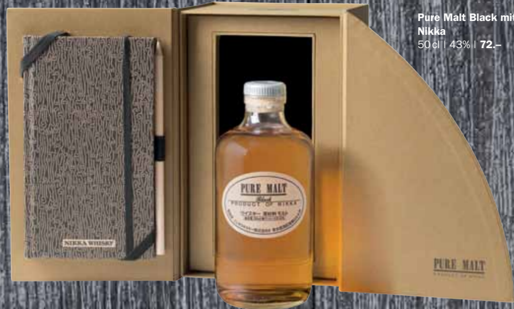
Pure Malt Black mit Tasting Book Nikka 50cl | 43% | 72.-