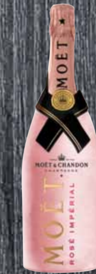
Champagne brut rosé Diamond Suit Moët & Chandon 75cl | 59.-