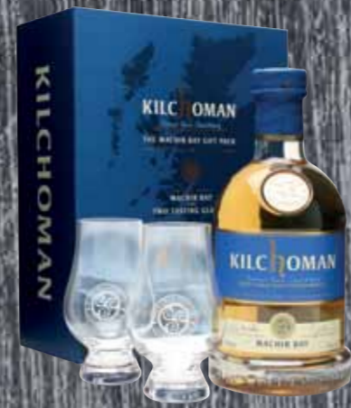
Single Malt Machir Bay mit 2 Gläsern Kilchoman 70cl | 48% | 74.-