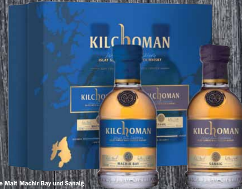
Single Malt Machir Bay und Sanaig Kilchoman 40cl | 46% | 59.-