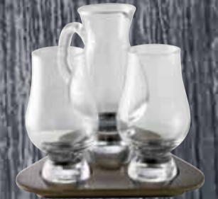
Degustations-Set 2 Whiskygläser und 1 Wasserkrug Glencalm Set | 49.- Glas 1er-Karton | 6.50