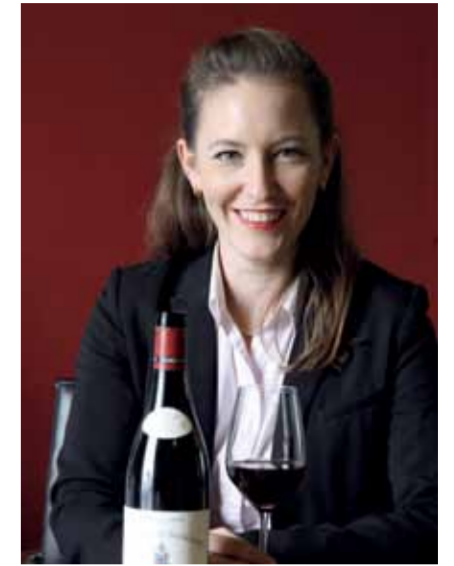
Produkt und Brand Manager Wein & Bier