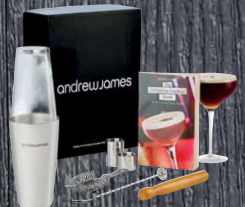
Bar-Set mit Boston-Shaker-Glas Andrew James 32.-* statt 39.-