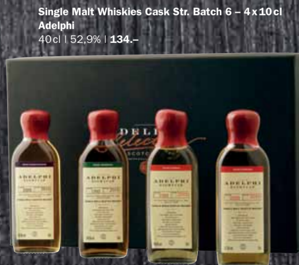
Single Malt Whiskies Cask Str. Batch 6 - 4x10cl Adelphi 40cl | 52,9% | 134.-