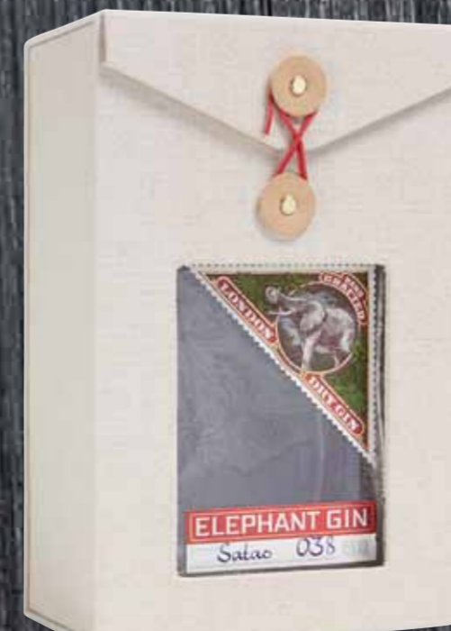
Elephant Gin Box Elephant 50cl | 45% | 51.-