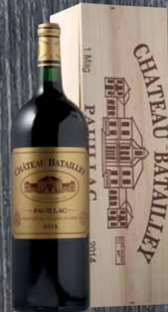
Pauillac ac 5e Cru Classé Château 1er HK 2014 Batailley 75cl | 89.-