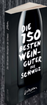
Die 150 besten Weingüter der Schweiz Intervinum Verlag 19.90