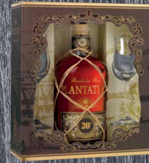
Rum XO 20 th Anniversary mit 2 Nosing-Gläsern Plantation 70cl | 40% | 75.-