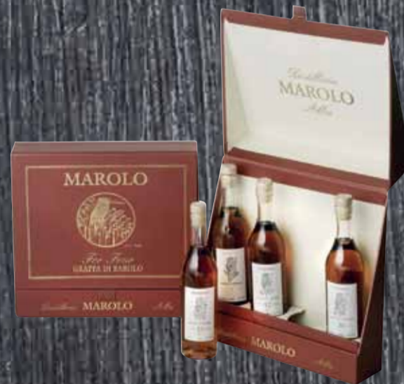
Grappa di Barolo 4x20cl (9J. - 12J. - 15J. - 20J.) Marolo 80cl | 50% | 137.-