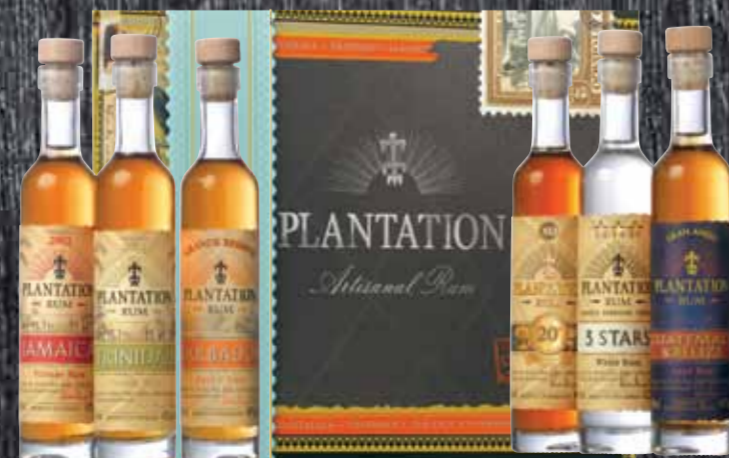
Grand Crus - Cigar Box - 6x10cl Plantation 60cl | 41,2% | 59.-