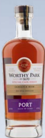
Limited Edition Port Cask Jamaica Pot Still Rum 10 Years Worthy Park Estate 70 cl | 45 % | 99.-