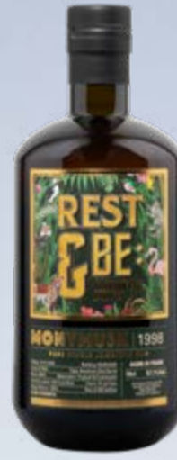
Monymusk Rest & Be Thankful MBK Single Cask Jamaican Rum 24 Years 1998 SVM Scheer & Velier 70 cl | 57.1 % | 365.-