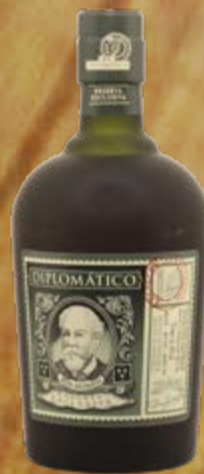
Reserva Exclusiva Ron Diplomático

Grâce à un long vieillissement dans des fûts de chêne blanc exclusifs, ce rhum a un corps très intense avec un équilibre parfait. Un rhum qui reflète l'expérience traditionnelle et le travail manuel de la distillerie sous toutes ses facettes. 70 cl | 40 % | ACTUELLE 44.90