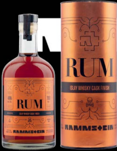
Islay Whisky Cask Finish Limited Edition Rum Rammstein 70 cl | 46 % | 74.-