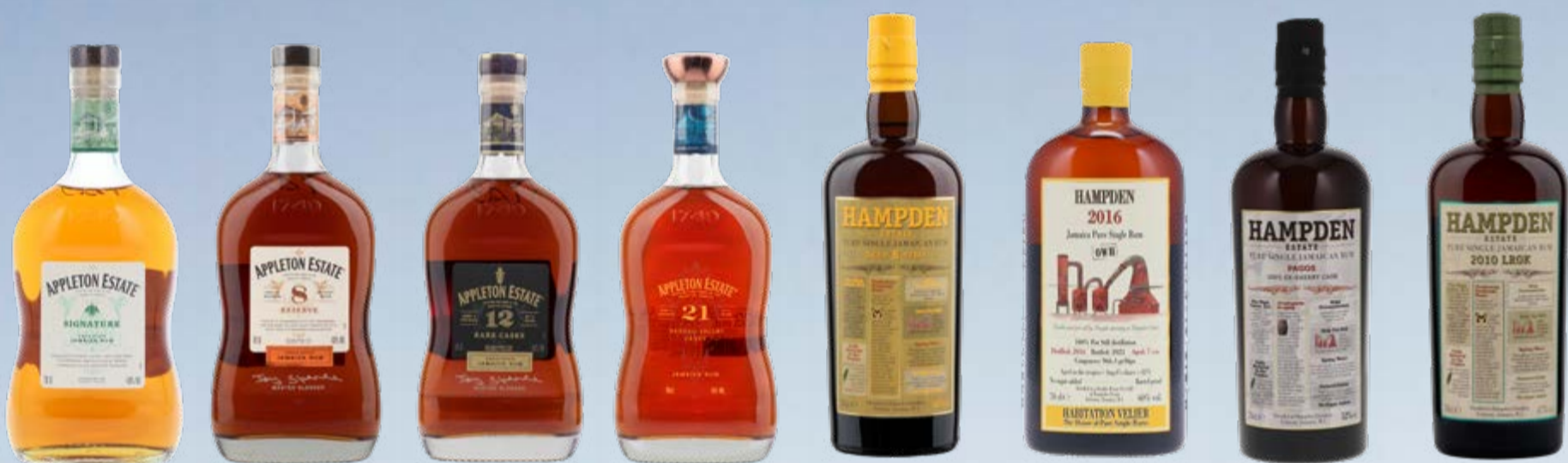
Signature Jamaica Rum Appleton Estate 70 cl | 40 % | 32.90

L'histoire du rhum est indissociable des Caraïbes et de la Jamaïque en particulier. Un style propre s'y est développé, avec des distillats authentiques sans ajout de sucre ni d'arômes. Les rhums produits traditionnellement dans un alambic pot still se caractérisent par une puissante complexité et des notes intenses de fruits tropicaux mûrs, dues à une forte teneur en esters. Les esters sont des molécules qui se forment après une fermentation prolongée de la mélasse de canne à sucre avec des levures en partie sauvages. Ils confèrent au rhum des arômes particulièrement riches et intenses, qui peuvent aller des fruits tropicaux aux épices, en passant par le caramel et la vanille. Seul le rhum réellement produit en Jamaïque peut porter l'appellation protégée «Jamaican Rum» qui en garantit la qualité et l'origine.