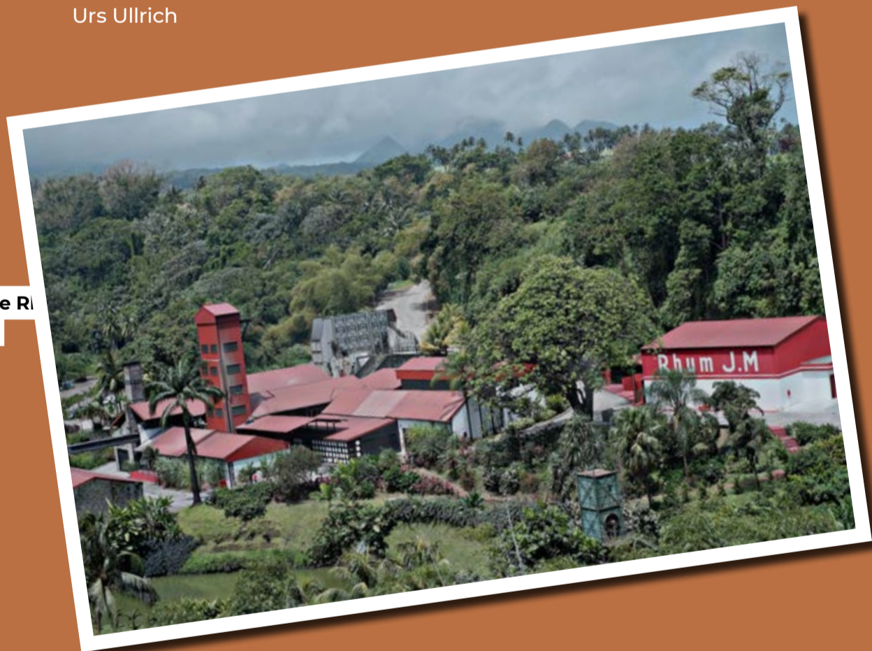
La distillerie de Rhum J.M. en Martinique

Pour un conseil personnalisé, rendez-vous dans l'un de nos Liquid Stores: