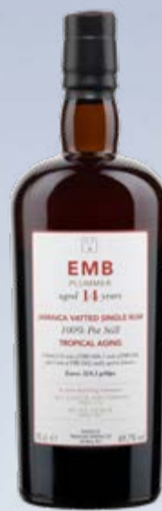
EMB Plummer Monymusk Tropical Aging Jamaica Vatted Single Rum 14 Years SVM Scheer & Velier 70 cl | 69.7 % | 189.-