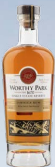
Single Estate Reserve Jamaica Rum Pot Still Distilled Worthy Park Estate 70 cl | 45 % | 75.-