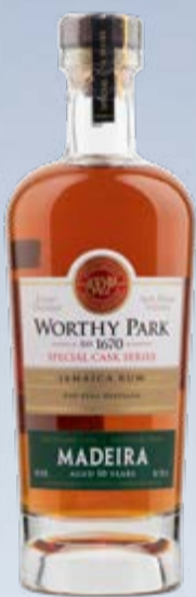
Limited Edition Madeira Cask Rum 10 Years Worthy Park Estate 70 cl | 45 % | 99.-