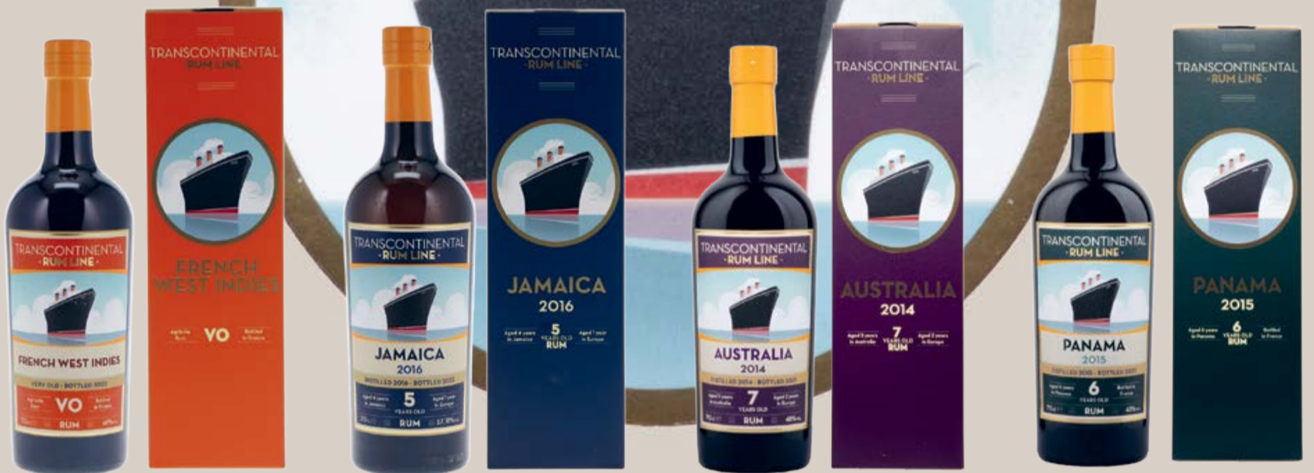
French West Indies VO Agricole Rum Very Old Transcontinental Rum Line 70 cl | 46 % | 64.-