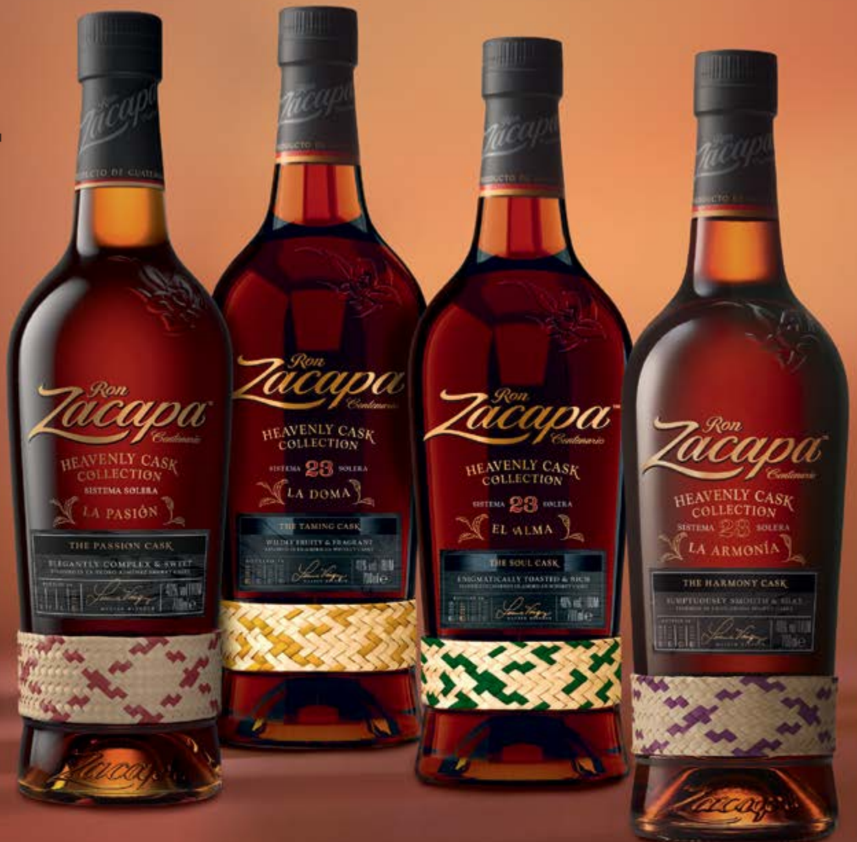
Heavenly Cask Collection Sistema 23 Solera La Armonia Ron Zacapa 70 cl | 40 % | 98.-