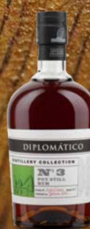
Distillery Collection N°3 Batch Pot Still Rum Diplomático

Le Ron Diplomático Distiller Collection N° 2 est produit à partir de mélasse et distillé avec le Barbet Column Still. Le Brabet Column Still a été importé de France au Venezuela en 1959. 70 cl | 47 % | ACTUELLE 69.-