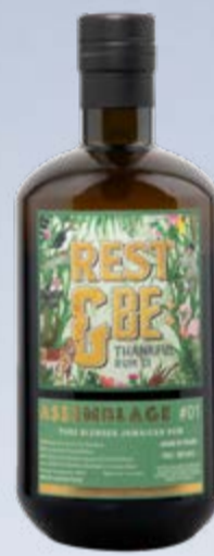
Monymusk Rest & Be Thankful Assemblage #1 Jamaican Rum 13 Years 2009 SVM Scheer & Velier 70 cl | 46 % | 139.-