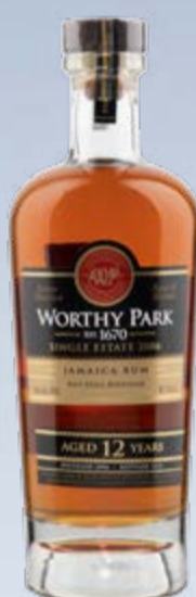
Single Estate 2006 Jamaica Rum Pot Still Distilled 2006 Worthy Park Estate 70 cl | 56 % | 149.-