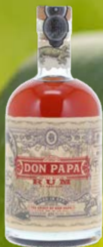
Small Batch Rum Based Spirit Drink 7 Years