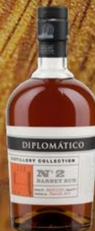
Distillery Collection N°2 Batch Barbet Rum Diplomático

Un mélange complexe et varié de rhums authentiques. Son goût raffiné s'inspire des « mantuanos », des nobles vénézuéliens du XIXe siècle, connus pour leur perspicacité et leur bon goût. 70 cl | 40 % | ACTUELLE 34.-