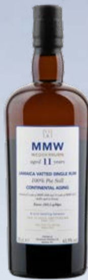
MMW Wedderburn Monymusk Continental Aging Jamaican Vatted Single Rum 11 Years SVM Scheer & Velier 70 cl | 63.9 % | 149.-