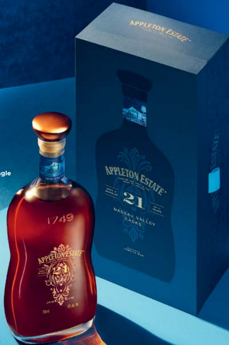
Nassau Valley Cask Single Estate Jamaican Rum 21 Years Appleton Estate 70 cl | 43 % | 128.-