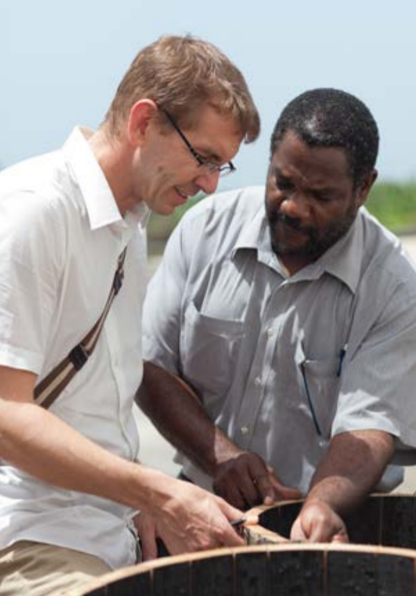
Urs Ullrich en visite à la Barbade