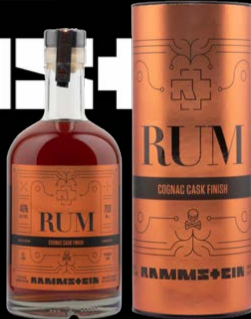
Cognac Cask Finish Limited Edition Rum Rammstein 70 cl | 46 % | ACTUELLE 69.-