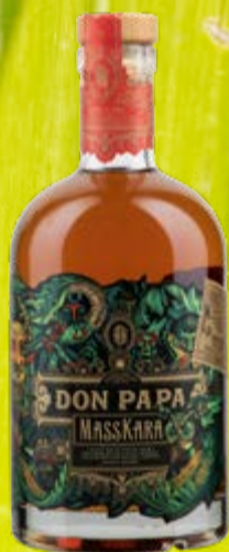
Masskara Rum Based Spirit Drink Don Papa

L'exotique Don Papa Baroko est produit avec un grand souci du détail sur l'île de Negros. Elle fait partie de l'archipel des Philippines et est appelée Sugarlandia par les autochtones. Don Papa Baroko et ses frères sont à base de ce que l'on appelle « l'or noir », nom donné à la mélasse locale, particulièrement riche. 70 cl | 40 % | ACTUELLE 49.50