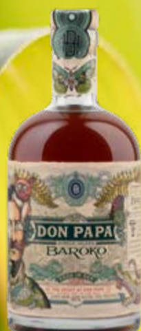
Baroko Rum Based Spirit Drink Don Papa

Le nez est doux, avec des notes de vanille, de menthe et d'épices, suivies en bouche par des fruits confits, du caramel et des épices exotiques. 70 cl | 40 % | ACTUELLE 52.90