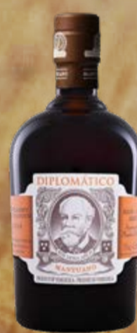
Mantuano Ron Diplomático

Grâce à un long vieillissement dans des fûts de chêne blanc exclusifs, ce rhum a un corps très intense avec un équilibre parfait. Un rhum qui reflète l'expérience traditionnelle et le travail manuel de la distillerie sous toutes ses facettes. 70 cl | 40 % | ACTUELLE 44.90