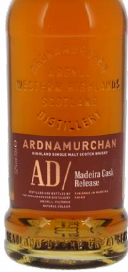
Madeira Cask Batch 2 Highland Single Malt Scotch Whisky Ardnamurchan 70 cl | 52 % | 76.-