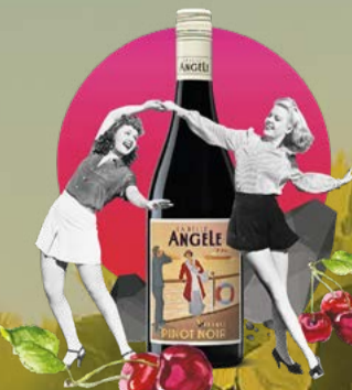
Pinot Noir 2023 La Belle Angèle 75 cl | 13 % | 11.80