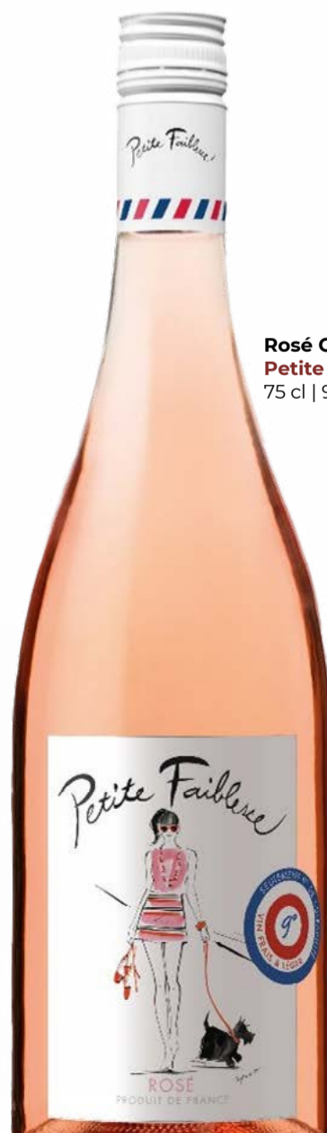
Rosé Côtes de Gascogne IGP 2024 Petite Faiblesse 75 cl | 9 % | 12.80