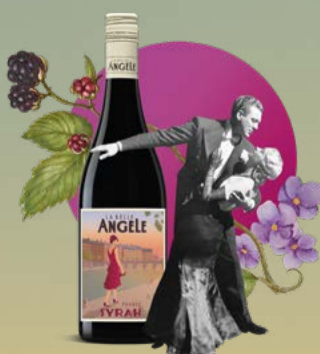
Syrah 2024 La Belle Angèle 75 cl | 13 % | 9.80