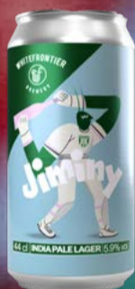
Jiminy KA 12x DO WhiteFrontier

Leicht, floral, super trinkbar: The Didi's ist das Pale Ale für entspannte Momente mit Charakter. Mit 5.2 % Vol., subtilen Hopfennoten und angenehmer Frische - genau das, was man braucht, wenn man nix braucht ausser was Cutes im Glas. 44 cl | 5.3 % | 6.90