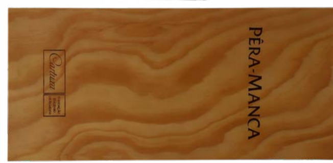
Péra-Manca Tinto Alentejo DOC 2018 Cartuxa 75 cl | 15.5 % | 465.-