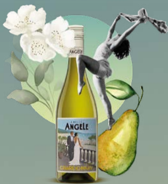
Chardonnay 2024 La Belle Angèle 75 cl | 12.5 % | 9.80