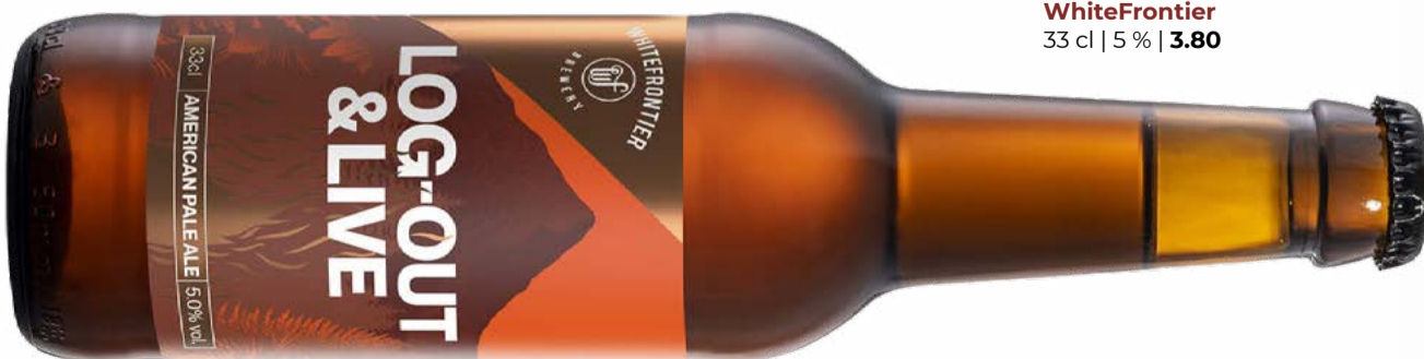
Log Out & Live KA 12x EW WhiteFrontier 33 cl | 5 % | 3.80