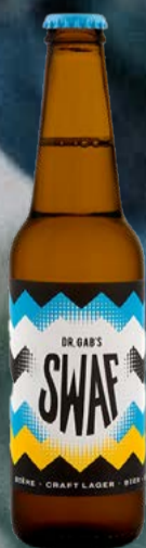
SWAF Craft Lager KA 8x EW Docteur Gab's

Dégustez notre Lemon Sour 4,9%: la fraîcheur vivifiante du citron d'Amalfi fusionne avec une base maltée légère pour créer une boisson audacieuse, fruitée et parfaitement équilibrée. Chaque gorgée révèle une acidité maîtrisée et un final délicatement pétillant, idéal pour toutes vos occasions. À vivre intense. Vite!Go! 44 cl | 4.9 % | 6.-