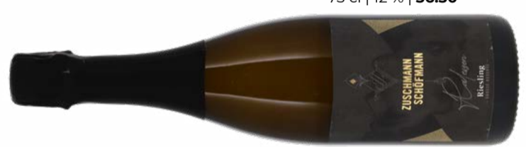
Riesling Ralsessen Grosse Reserve G.U. Extra Brut Weinviertel DAC 2020 Zuschmann-Schöfmann 75 cl | 12 % | 36.50