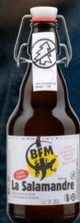
La Salamandre Bière blanche non filtrée HA 20 x MW BFM

Une lager limpide, fraîche et équilibrée, avec une touche d'agrumes et un look urbain. SWAF, c'est la bière craft des amateurs de finesse et de style. Quand la tradition rencontre l'art contemporain. 33 cl | 4.5 % | 1.60 au lieu de 1.80