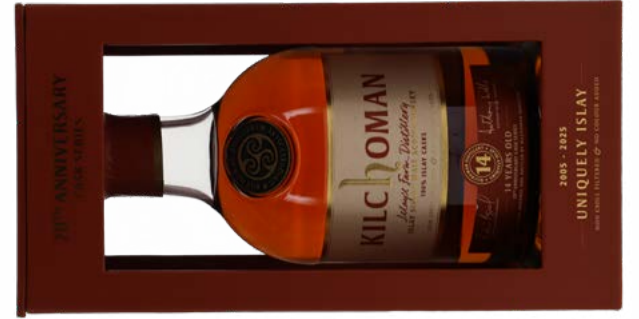
Anniversary Cask Series: 14 Year Old Ex-Sherry Butts, 100% Islay Casks Islay Single Malt Scotch Whisky 14 2011 Kilchoman 70 cl | 55 % | 168.-