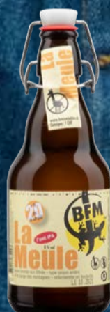
La Meule Bière blonde non filtrée HA 20 x MW BFM

Weissbier à la mousse crémeuse et à la note florale épicée. Légères nuances de levure. Une bière d'apéritif rafraîchissante à son meilleur. Brassé à partir de malt de blé et d'orge du Jurassique. 33 cl | 5.5 % | 4.- au lieu de 4.50