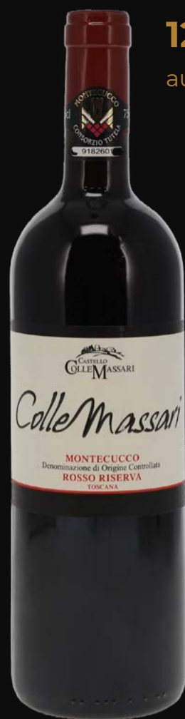
Riserva Montecucco DOC 2020 ColleMassari 75 cl | 14%