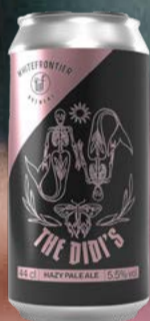
The Didi's KA 12x DO WhiteFrontier

Leicht, floral, super trinkbar: The Didi's ist das Pale Ale für entspannte Momente mit Charakter. Mit 5.2 % Vol., subtilen Hopfennoten und angenehmer Frische - genau das, was man braucht, wenn man nix braucht ausser was Cutes im Glas. 44 cl | 5.3 % | 6.90