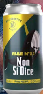
Rule N°2: Non Si Dice KA 12x DO WhiteFrontier

Croustillante, fraîche et explosive: Jiminy IPL marie une finale sèche avec des arômes d'agrumes intenses et de résine, grâce à un dry hopping à froid élaboré. Issue d'une collaboration avec Cervesa Espiga, cette India Pale Lager redéfinit la fraîcheur - un must pour les amateurs de bières innovantes! 44 cl | 5.9 % | 6.90