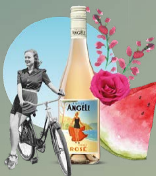
Rosé 2024 La Belle Angèle 75 cl | 12.5 % | 9.80