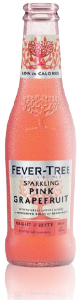
Sparkling Pink Grapefruit 4er Pack Kohlensäurehaltiges Erfrischungsgetränk Fever-Tree 20 cl | 7.80

5 cl de vodka Crystal Head 15 cl de Fever-Tree Sparkling Pink Grapefruit 1 cl de jus de citron vert frais (facultatif, pour plus de fraîcheur) Glaçons Décoration : tranche de pamplemousse, branche de menthe ou romarin