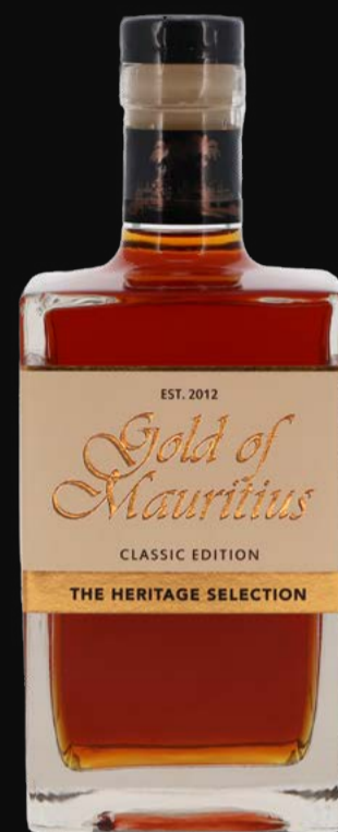
Dark Rum Gold of Mauritius 70 cl | 40%

* Offre (8,1 % de TVA incluse) valable jusqu'au 31/08/2025. Non cumulable avec d'autres réductions. Non valable pour les spiritueux en raison de la réglementation sur l'alcool.