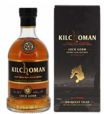
Loch Gorm Sherry Cask Ed. 2025 Islay Single Malt Scotch Whisky 10 Years Kilchoman 70 cl | 46 % | 104.-