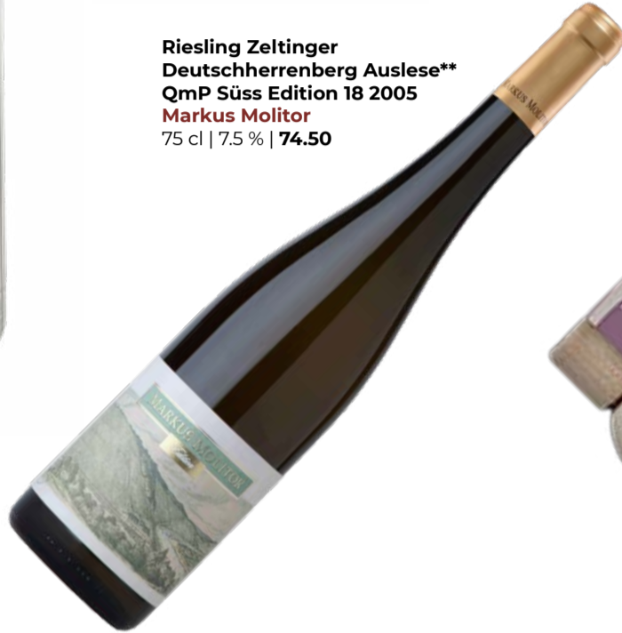
Riesling Zeltinger Deutscherherberg Auslese** QmP Süss Edition 18 2005 Markus Molitor 75 cl | 7.5 % | 74.50