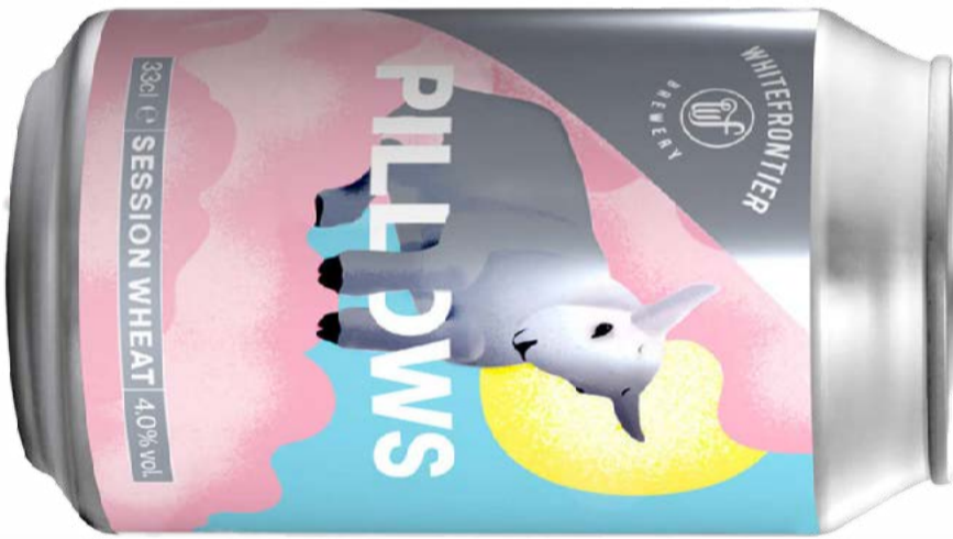
Pillows KA 12x DO WhiteFrontier 33 cl | 4 % | 3.60