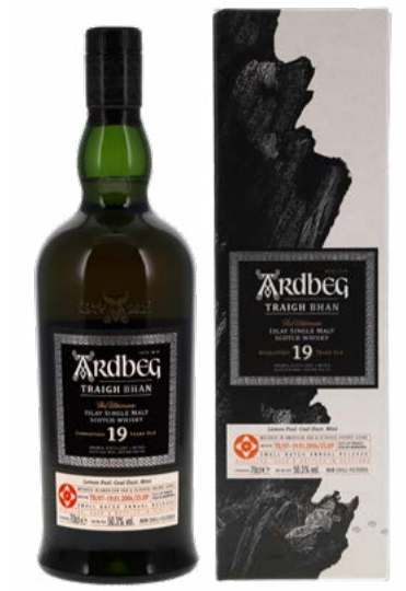
Traigh Bhan #7 Islay Single Malt Scotch 19 Years Ardbeg 70 cl | 50.3 % | 289.-