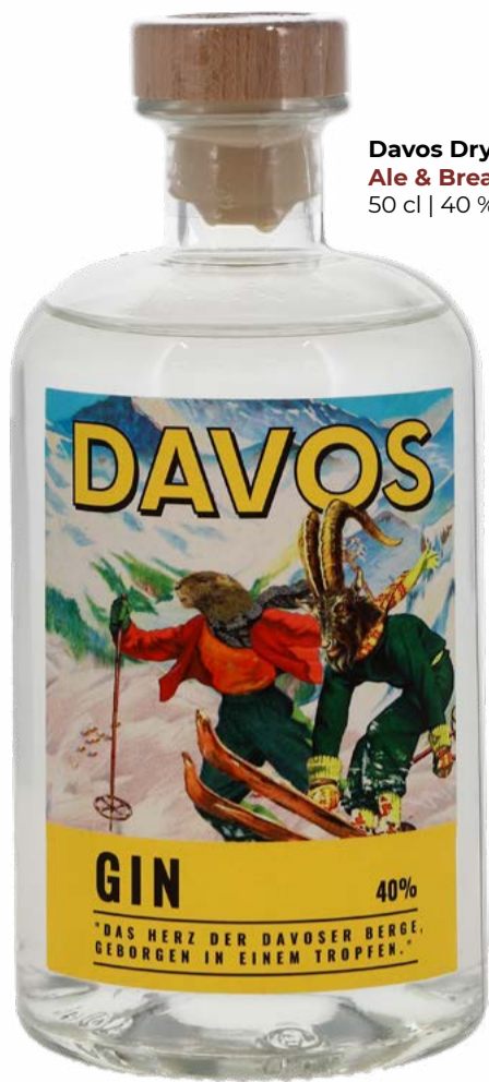
Davos Dry Gin Ale & Bread 50 cl | 40 % | 55.-