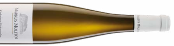
Riesling Auslese Kinheimer Hubertuslay Mosel QmP Troocken 2018 Markus Molitor 75 cl | 12.5 % | 55.50