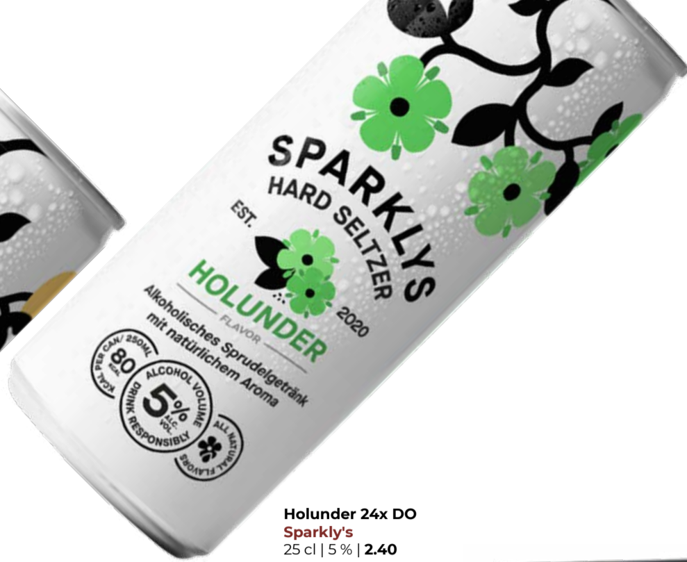
Holunder 24x DO Sparkly's 25 cl | 5 % | 2.40