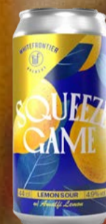
Squeeze Game KA 12x DO WhiteFrontier

Rule N°2 - une NEIPA non bouillie, riche, juteuse et audacieuse. Arômes tropicaux intenses, texture veloutée et équilibre parfait entre fraîcheur et amertume. Une technique éco-responsable pour un résultat aromatique bluffant. À découvrir absolument. 44 cl | 6.5 % | 7.50