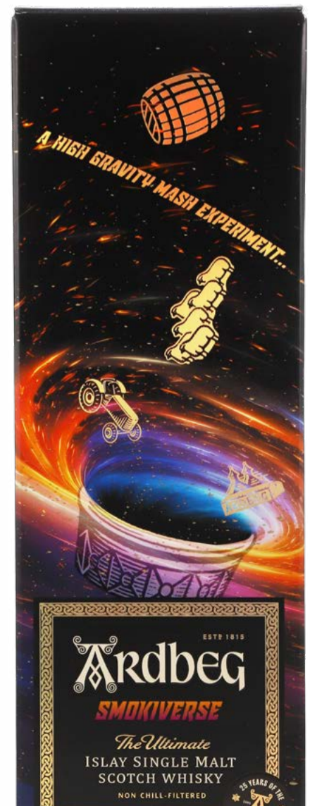
Smokiverse Islay Single Malt Scotch Ardbeg 70 cl | 48.3 % | 119.-