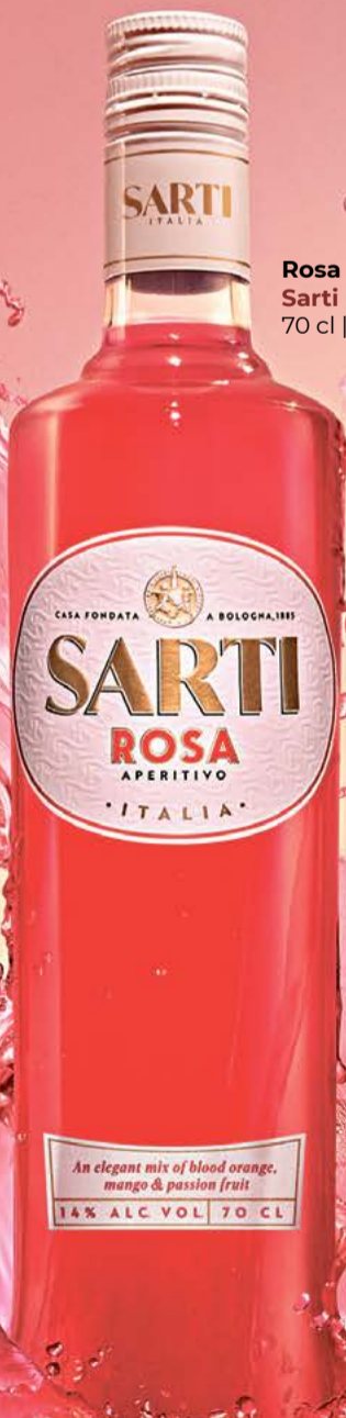
Rosa Liqueur Sarti 70 cl | 14 % | ACTUELLE 19.50

NOTES DE MANGUE, DE FRUIT DE LA PASSION ET D'ORANGE SANGUINE