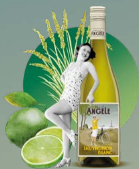
Sauvignon Blanc 2024 La Belle Angèle 75 cl | 12 % | 9.80