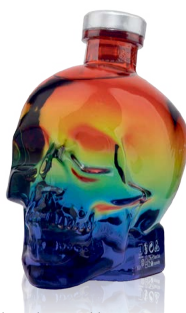
Pride Rainbow Edition Vodka Crystal Head 70 cl | 40 % | ACTUELLE 69.-