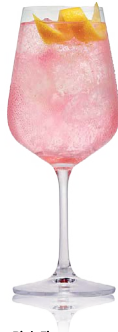
Pink Fizz Cocktail

5 cl de vodka Crystal Head 15 cl de Fever-Tree Sparkling Pink Grapefruit 1 cl de jus de citron vert frais (facultatif, pour plus de fraîcheur) Glaçons Décoration : tranche de pamplemousse, branche de menthe ou romarin