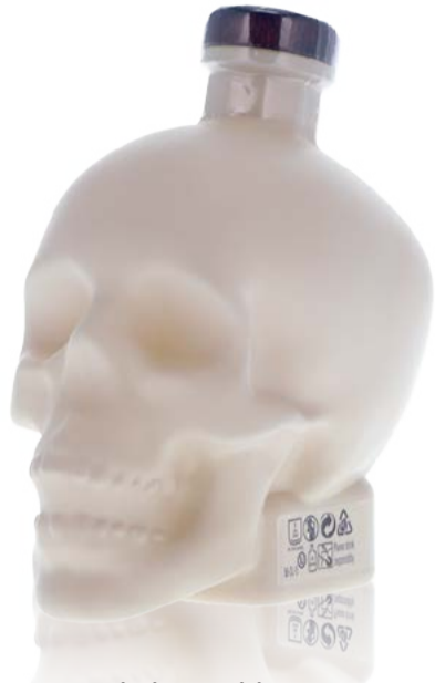
Bone Limited Edition Vodka Crystal Head 70 cl | 40 % | ACTUELLE 69.-