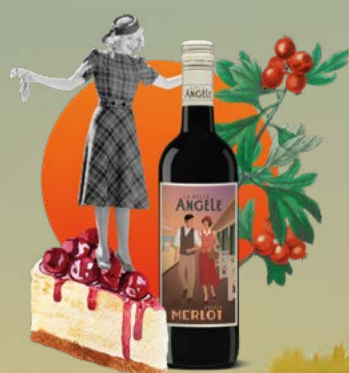
Merlot 2023 La Belle Angèle 75 cl | 13 % | 9.80