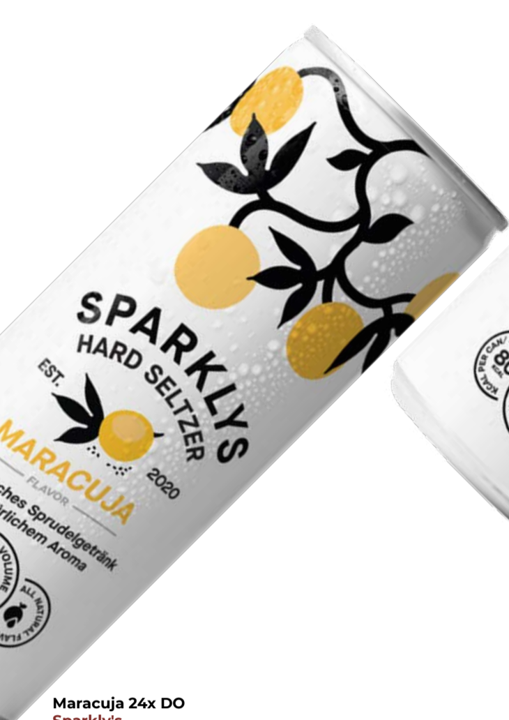
Maracuja 24x DO Sparkly's 25 cl | 5 % | 2.40