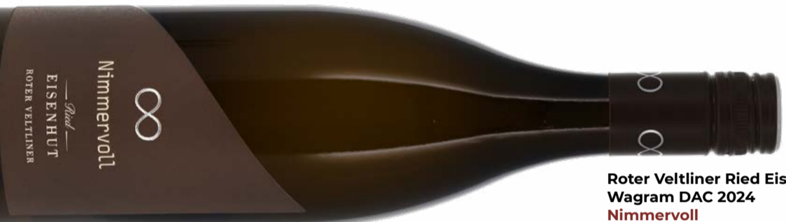
Roter Veltliner Ried Eisenhut Wagram DAC 2024 Nimmervoll 75 cl | 13.5 % | 29.40