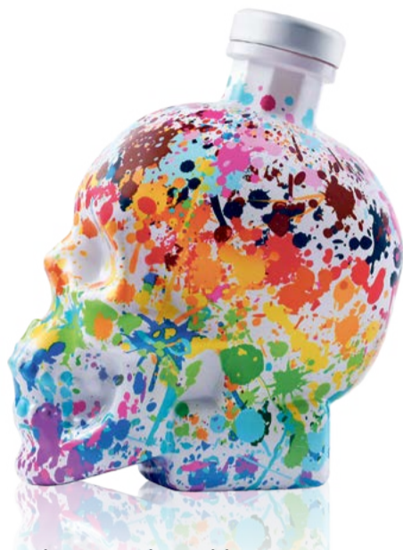
Paint Your Pride Edition Vodka Crystal Head 70 cl | 40 % | ACTUELLE 69.-