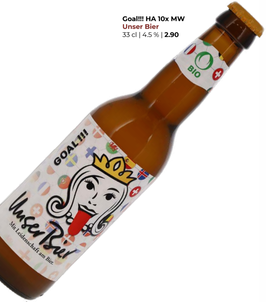
Goal!!! HA 10x MW Unser Bier 33 cl | 4.5 % | 2.90