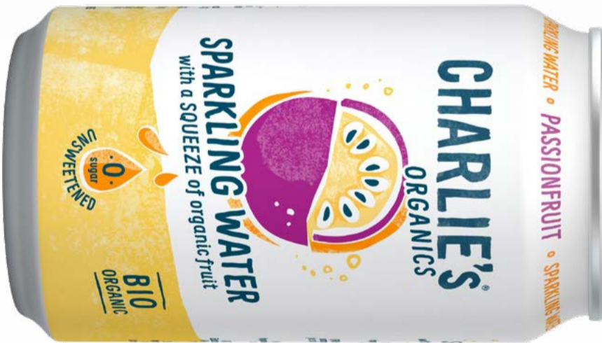
Passionfruit Soda 12x DO Charlie's Organics 33 cl | 2.50