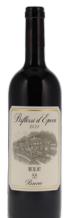
Riflessi d'Epoca Merlot Ticino DOC 2021 Brivio 75 cl | 39.- au lieu de 42.90