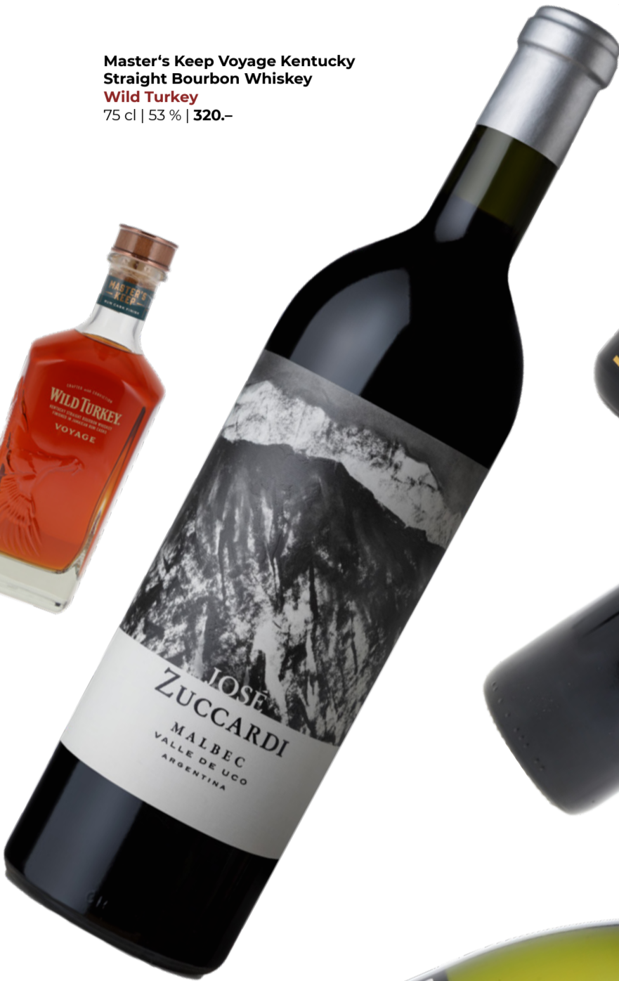
Master's Keep Voyage Kentucky Straight Bourbon Whiskey Wild Turkey 75 cl | 53 % | 320.-