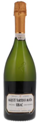
Gran Reserva UBAC Cava DO 2017 Agustí Torelló Mata 75 cl | 17.50 au lieu de 22.-