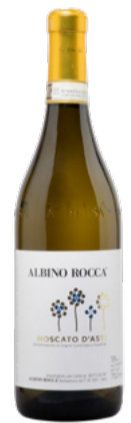
Moscato d'Asti DOCG 2023 Albino Rocca 75 cl | 14.- au lieu de 17.50