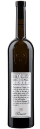
Bianco Rovere Bianco di Merlot Ticino DOC 2022 Brivio 75 cl | 30.- au lieu de 33.50