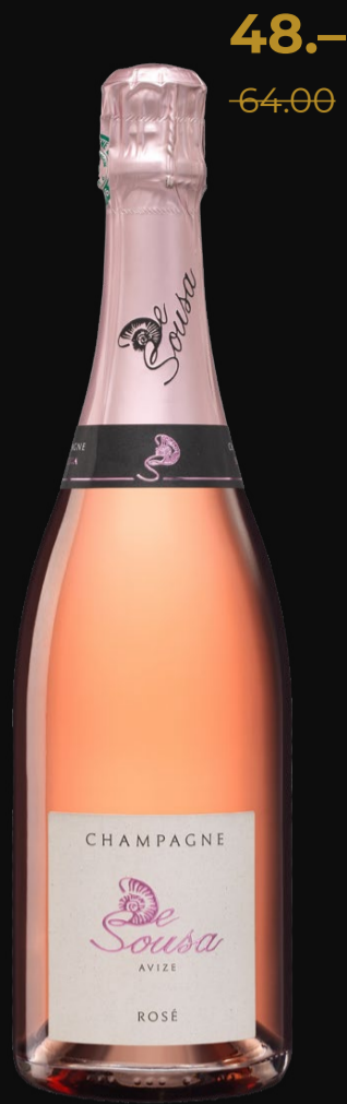
Rosé Brut Champagne AC De Sousa 75 cl | 2.5%