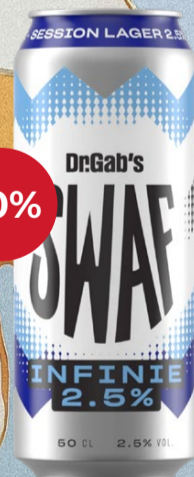
SWAF INFINIE 6x DO Docteur Gab's

Avec seulement 2,5 % d'alcool, cette Session Lager allie légèreté et véritable caractère de bière. D'une couleur dorée dans le verre, avec une base légèrement maltée et une amertume agréablement fraîche, elle se révèle limpide, équilibrée et remarquablement accessible. C'est précisément sa faible teneur en alcool qui la rend particulièrement attrayante, simple, moderne et idéale pour tous ceux qui recherchent un goût intense avec plus de légèreté. Une bière qui se boit sans effort tout en affichant un caractère bien affirmé. 50 cl | 2.5% | 2.15 -2.40