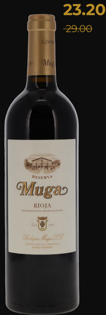
Reserva Rioja DOCa 2021 Muga 75 cl | 14.5%

* Offre (8,1 % de TVA incluse) valable jusqu'au 30/06/2026. Non cumulable avec d'autres réductions. Non valable pour les spiritueux en raison de la réglementation sur l'alcool.