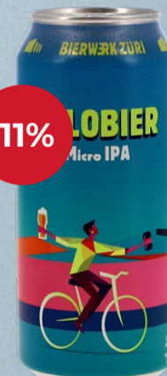
Velobier Micro IPA KA 24x DO Bierwerk Züri

Avec ses 2,8 %, cette Micro IPA incarne le genre avec une précision remarquable : légère en alcool, mais nullement insipide dans son expression. Un mélange de malts particulier lui confère un corps étonnamment ample, tandis que les houblons Sabro, Talus, Callista et Chinook développent un bouquet fruité aux notes d'agrumes marquées. Il en résulte une bière qui allie avec élégance facilité de dégustation et caractère - moderne, originale et idéale pour tous ceux qui recherchent une légèreté aromatique avec un véritable caractère IPA. 44 cl | 2.8% | 3.90 -4.40