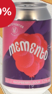
Memento Vivi KA 12x DO WhiteFrontier

Avec sa robe rose, ses arômes intenses de framboise et son acidité fine et équilibrée, cette Raspberry Sour apporte immédiatement une ambiance de bord de mer et de plage dans votre verre. À la fois fruitée, douce et rafraîchissante, elle se révèle accessible, moderne et remarquablement harmonieuse. C'est précisément ce mélange de fruits rouges juteux, de texture douce et de fraîcheur cristalline qui en fait le compagnon idéal des après-midis chauds au bord de l'eau - une sensation d'insouciance, mais avec suffisamment de caractère pour se démarquer. 33 cl | 5.5% | 3.60 -