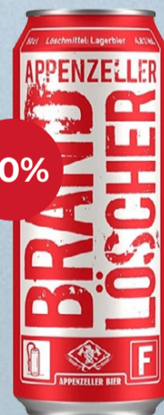
Brandlösscher 6x DO Appenzeller

La Brandlösscher ne se contente pas de mettre son idée en avant dans son nom, mais aussi dans son caractère : une bière pour les moments tendus, animés ou tout simplement pour éteindre sa soif. Son profil malté, doux et corsé est marqué par le malt caramel, tandis que l'amertume discrète du houblon et la finale sèche lui confèrent structure et équilibre. À cela s'ajoute la référence historique à l'incendie du village de 1560, qui apporte au produit une profondeur et une notoriété supplémentaires. 50 cl | 4.8% | 11.40* -12.60 *Disponible uniquement en lot de 6