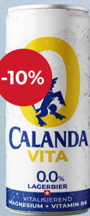
Lager Vita 0.0% 6x DO Calanda

Avec ses 0,0 %, cette bière s'inscrit parfaitement dans une culture de la bière moderne et responsable. D'une couleur jaune paille dans le verre, douce en bouche et d'une structure équilibrée, elle séduit par ses notes fruitées et son caractère vif et rafraîchissant. Le magnésium et la vitamine B6 confèrent à son profil une dimension contemporaine supplémentaire et soulignent son caractère dynamique et simple. Il en résulte une bière qui semble légère, mais qui reste néanmoins unique, harmonieuse et étonnamment polyvalente. 33 cl | 10.80* -12.- *Disponible uniquement en lot de 6